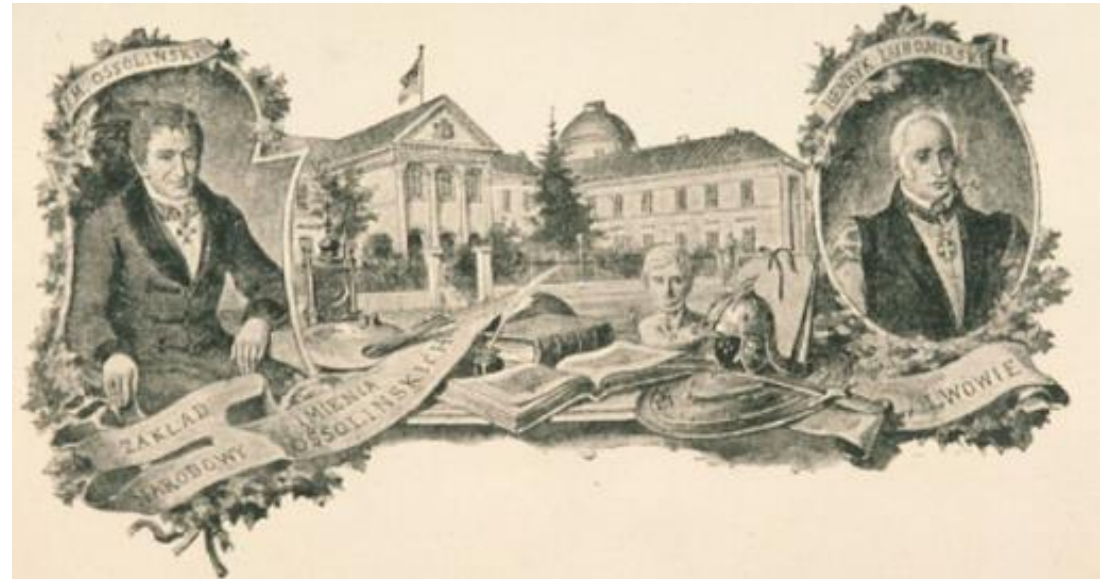
Zakład im. Ossolińskich we Lwowie