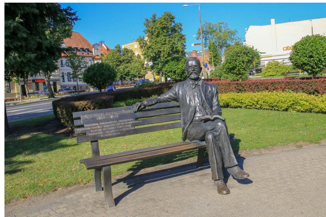
Ławeczka w Kętrzynie