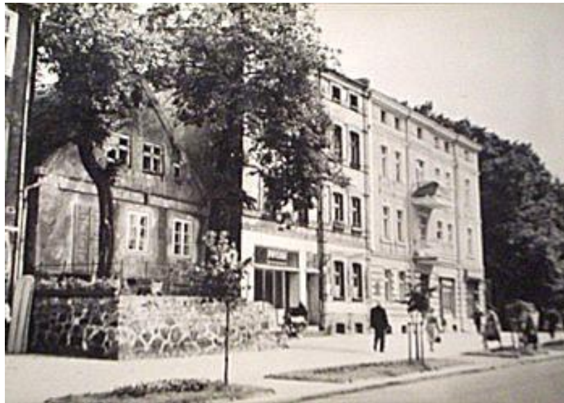
Dom Kętrzyńskiego w Giżycku