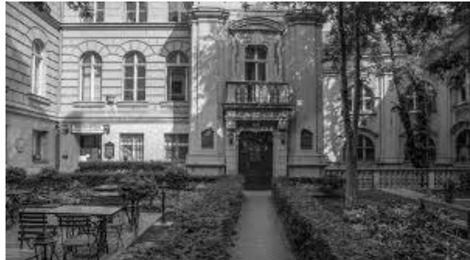
Poznańskie Towarzystwo Przyjaciół Nauk