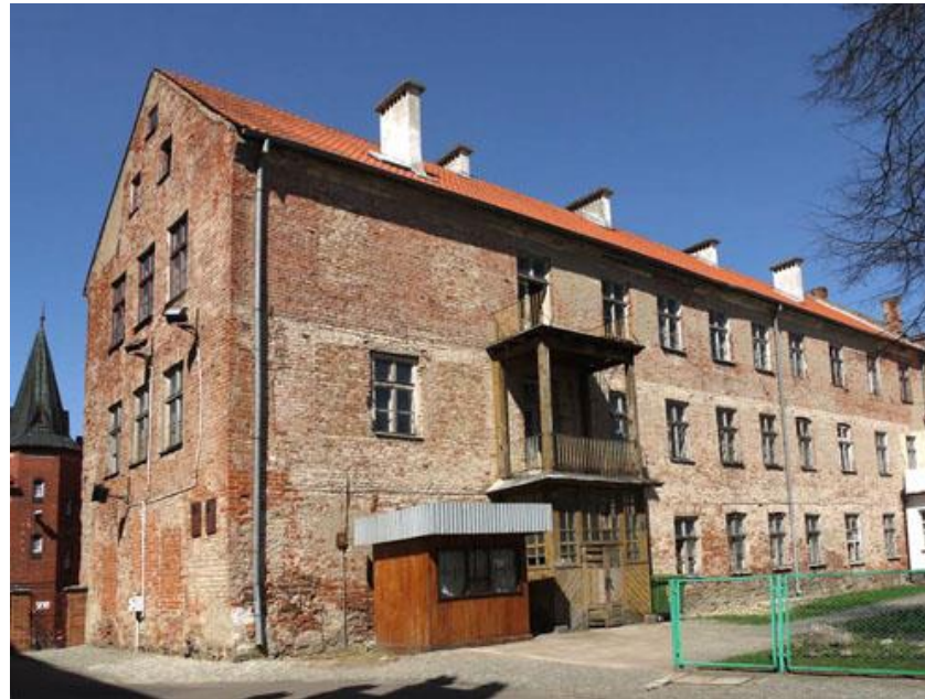
Budynek dawnego Gimnazjum