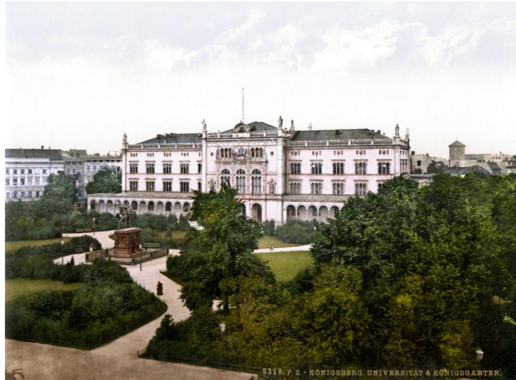
Uniwersytet Albrechta w Królewcu