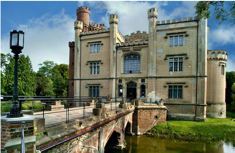
Zamek w Kórniku