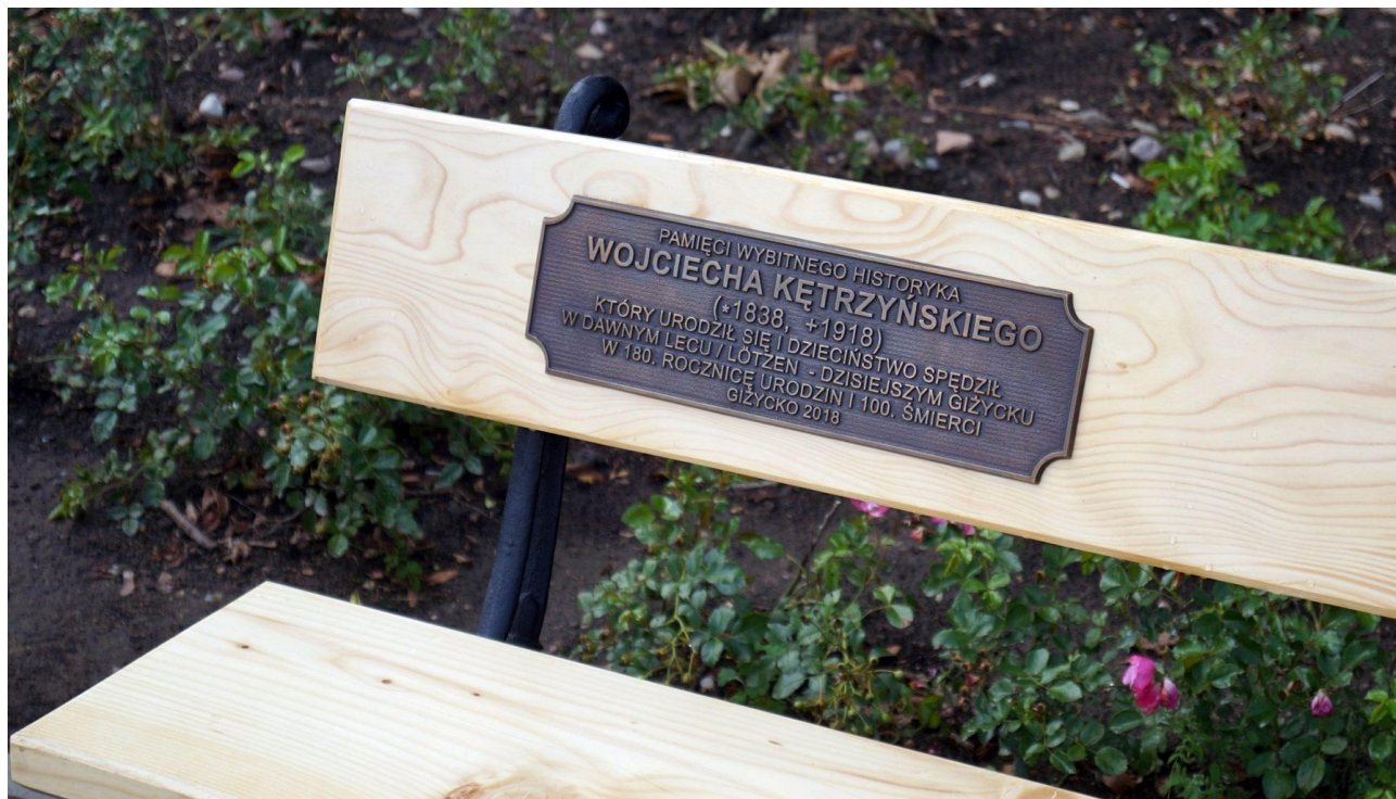
Ławeczka w Giżycku